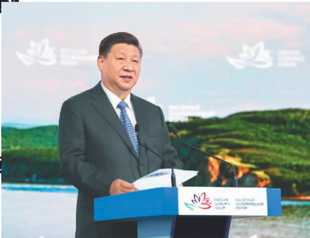
9月12日,第四届东方经济论坛全会在符拉迪沃斯托克举行。中国国家主席习近平出席并发表题为《共享远东发展新机遇 开创东北亚美好新未来》的致辞。