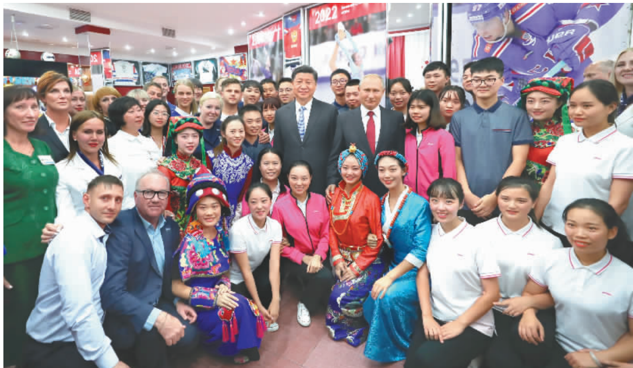
9月12日,国家主席习近平在符拉迪沃斯托克同俄罗斯总统普京一起访问“海洋”全俄儿童中心。这是习近平和普京同中俄青少年代表及中心教职工代表合影。

本报符拉迪沃斯托克9月12日电(记者韩显阳)国家主席习近平12日在符拉迪沃斯托克同俄罗斯总统普京一起访问“海洋”全俄儿童中心。