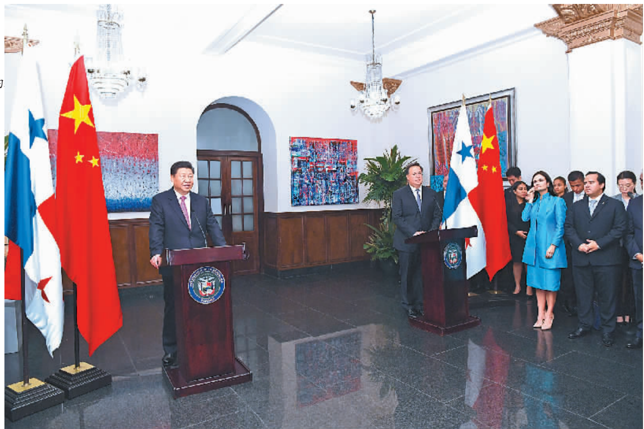
当地时间12月3日,国家主席习近平在巴拿马城和巴拿马总统巴雷拉共同会见出席中国-巴拿马经贸合作论坛的双方企业家代表。

新华社巴拿马城12月3日电(记者陈贻)当地时间12月3日,国家主席习近平在巴拿马城和巴拿马总统巴雷拉共同会见出席中国-巴拿马经贸合作论坛的双方企业家代表。 习近平指出,中巴建交为两国各领域合作开辟了广阔前景。两国经贸合作从来没有像今天这样丰富,双方企业界的联系从来没有像今天这样紧密。两国企业界是中巴合作的主力军,双方要抓住良好机遇,努力扩大合作。中国真诚向各国开放市场,欢迎包括巴拿马在内的世界各国企业家到中国投资兴业,也鼓励中国企业到巴拿马开拓发展,实现共同发展繁荣。