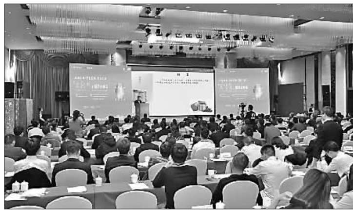
“文化融”制造业峰会现场。

“一个区域的文化积淀在这个区域和民族的血液里,构成这个区域的文化底色。”孙星分析,