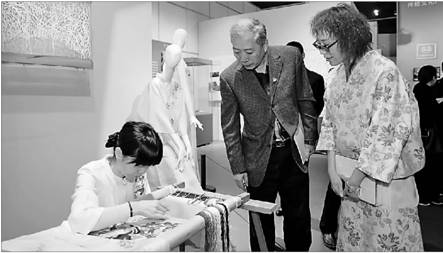
指尖上的台绣,百年手艺传承经典。图为专家在“文化融”制造业峰会展览上了解台州非遗台绣技艺。

台州既是“和合文化”的发源地,又是“制造业之都”。如何将传统文化与现代制造业相融,如何实现传统文化的创造性转化和创新性发展?峰会上,专家和企业家同台对话,设计师和管理者互动交流,艺术思维和技术思维碰撞,文化和产业产生“化学反应”。与会者认为,在台州现有的“七大千亿产业集群”中植入文化的内涵,能起到“点石成金”的作用,放大产业的文化价值,助力产业升级。